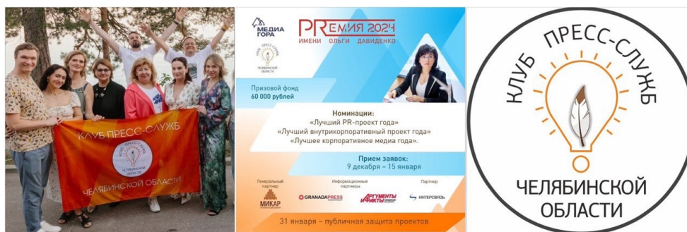
Рис. 1. Фирменный стиль Клуба пресс-служб Челябинской области до 2025 года.

Визуальная идентификация была выделена в качестве приоритетного направления ввиду её системного влияния: она усиливает коммуникативный потенциал, формирует основу для восприятия бренда и вносит существенный вклад в создание благоприятной психологической обстановки в коллективе Клуба. Тенденция эмоционального потребления контента, наметившаяся в нашем обществе в последние годы, особенно важна для общественных объединений, куда люди идут не только за профессиональной пользой, но и за эмоциями, которые быстрее всего дает визуал (Макашова, Лошманова 2024).