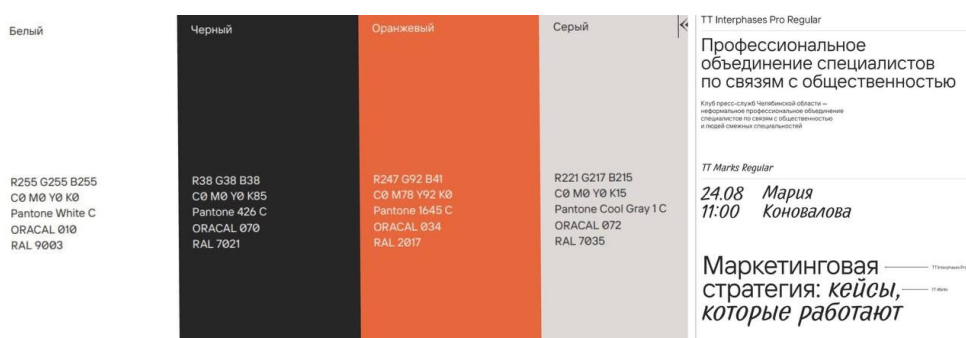
Рис. 3. Фирменные цвета и шрифты Клуба пресс-служб Челябинской области.

Знак Клуба пресс-служб основан на образе курсора ввода – символа начала текста и источника информации (см. рис. 2). Он отражает идеи профессиональной коммуникации, ответственности за слово и единого пространства для работы с новостями. Открывающие кавычки символизируют прямую речь и цитирование, а вместе с курсором образуют букву «К».